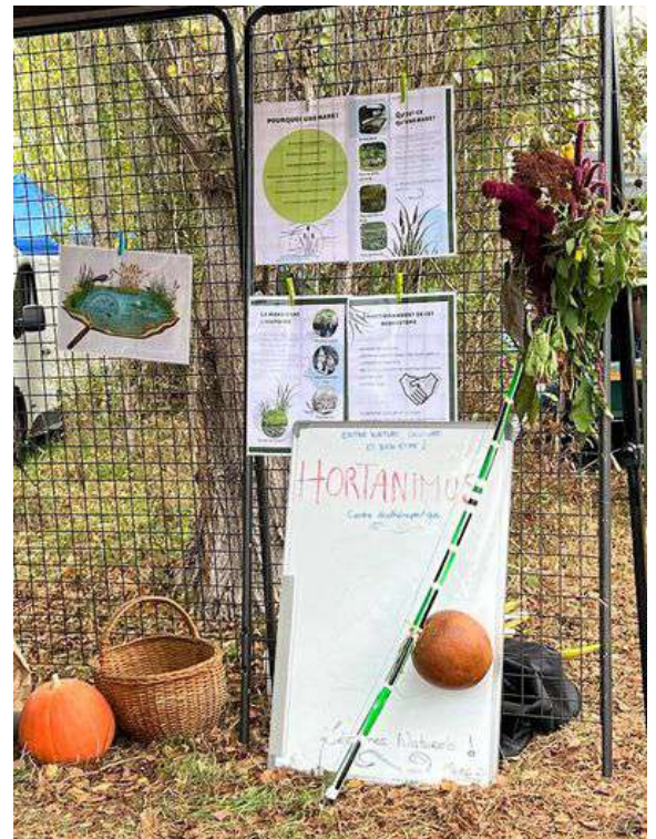
L'Adelphé rend visite à Hortanimus